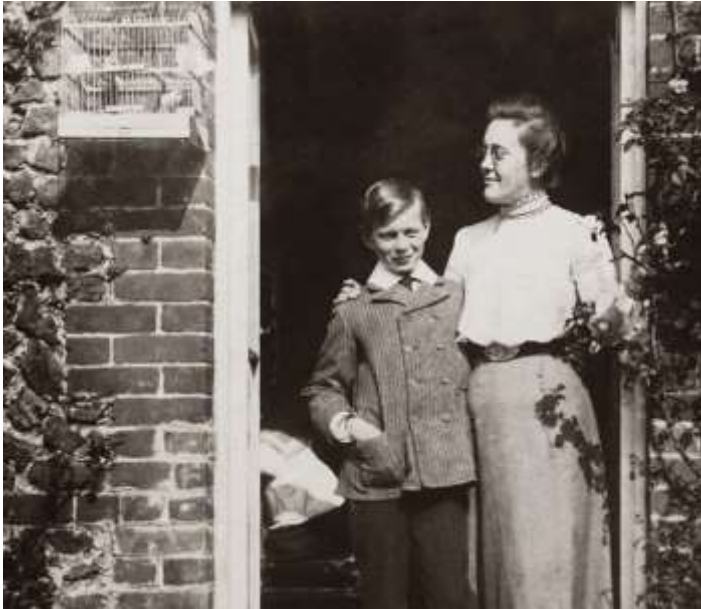
Joonis 3. Ema ja poeg