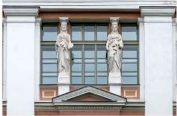
Joonis 1. Abrosimov (2015)

Kui olulist informatsiooni on teksti (sh märksõnade) asemel võimalik esitada pildi või videona, siis eelista seda. Kindlasti ära unusta lisada illustratsiooni alla viidet allikale (autor või kodulehe nimetus ja aasta).